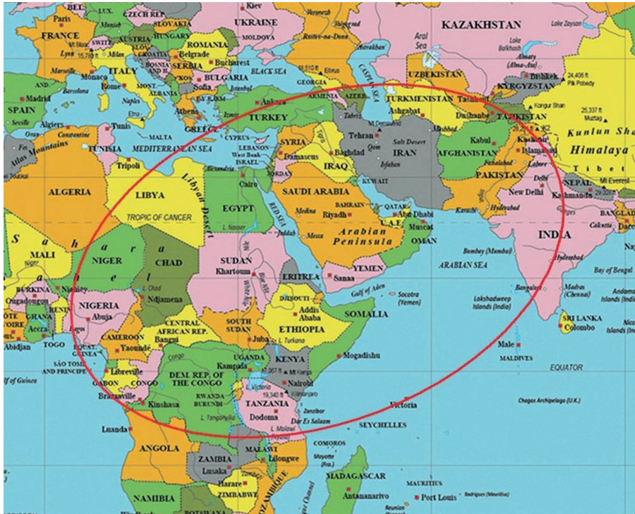
Figura 5 Elipse afroasiática 2