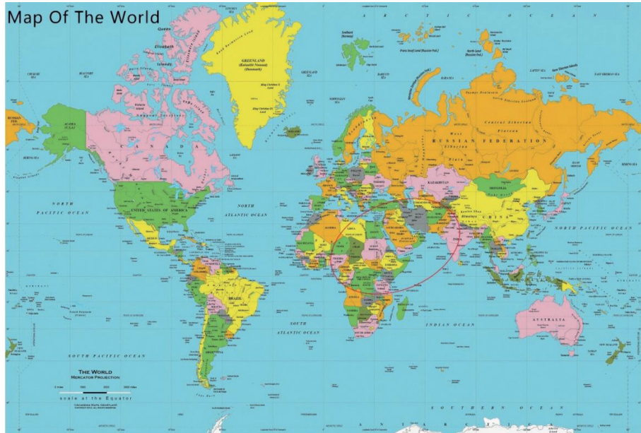
Figura 4 Elipse afroasiática