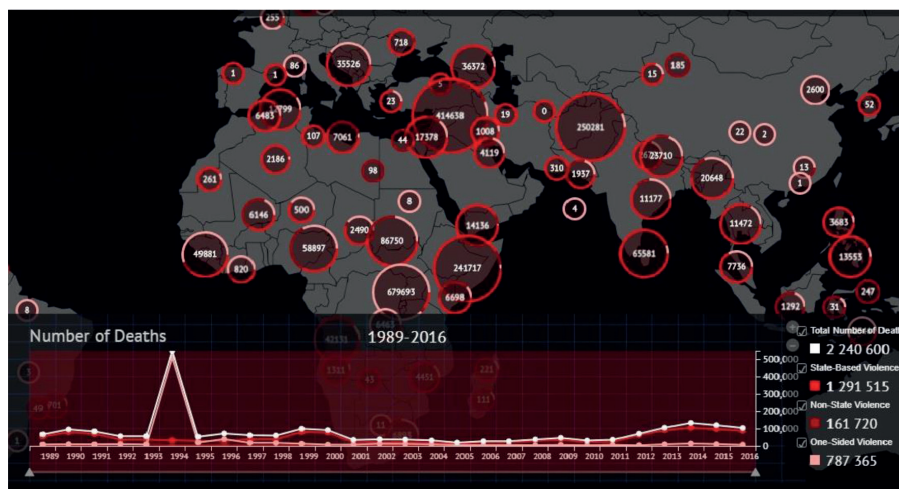
Figura 3 Uppsala Conflict Data Program