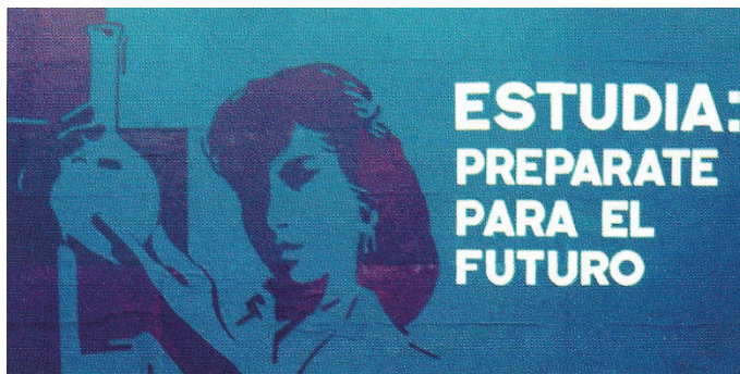
Imagen 4 Valla emplazada en La Habana, 1976